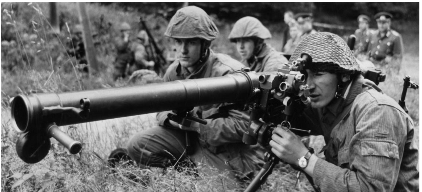
undatiert

Ausbildung im Gelände an schweren „Hand“feuerwaffen, beobachtet von den VP-Wachtmeistern und -offizieren. Gegen wen sollen aber die Waffen im ausgegerufenen „E-Fall“ gerichtet werden ...?!