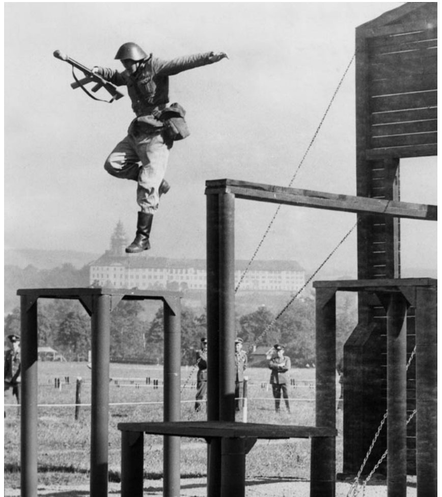
erschien am 19. 9. 1966

Ausbildung im Gelände an schweren „Hand“feuerwaffen, beobachtet von den VP-Wachtmeistern und -offizieren. Gegen wen sollen aber die Waffen im ausgegerufenen „E-Fall“ gerichtet werden ...?!