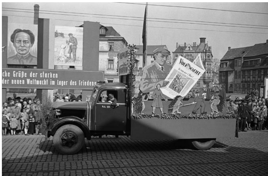
1. Mai 1954. Auf der Geraer Demonstration zum Internationalen Kampf- und Feiertag der Werktätigen wirbt ein Festwagen für die noch junge sozialistische Heimatzeitung.

Weitere Zeitungen des Namens „Volkswacht“ gab es in Berlin, Danzig, Essen, Freiburg/Breisgau, Rostock, Regensburg, Bernburg, Hagen, Stettin (KPD-Organ) sowie in Mährisch-Schönberg, Bistritz, Teplitz-Schönau (alle ČSR), St. Pölten, Österreich, und in der Schweiz: „Appenzeller Volkswacht“ und „Bündner Volkswacht“.