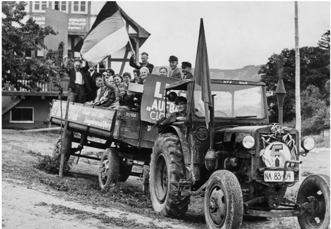
undatiert

LPG Clöwitz auf Agitationstour. Unter der Deutschlandfahne und mit dem Fünfjahrplan-Symbol voran: „Es lebe der Friede – Nieder mit den Kriegstreibern!“