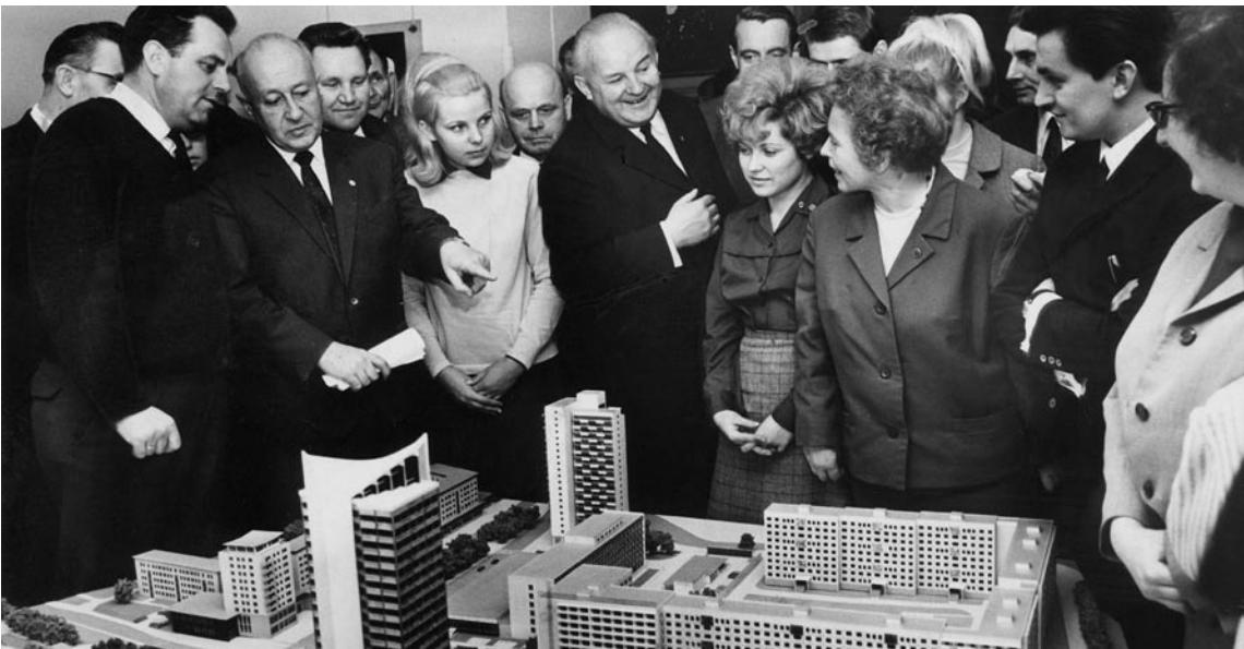
aufgenommen am 10. 1. 1968