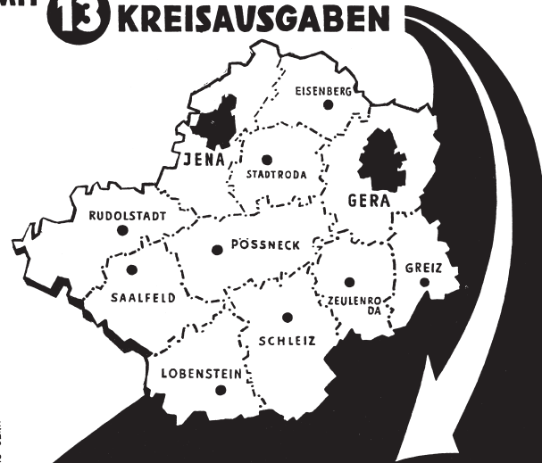
DEWAG - GERA