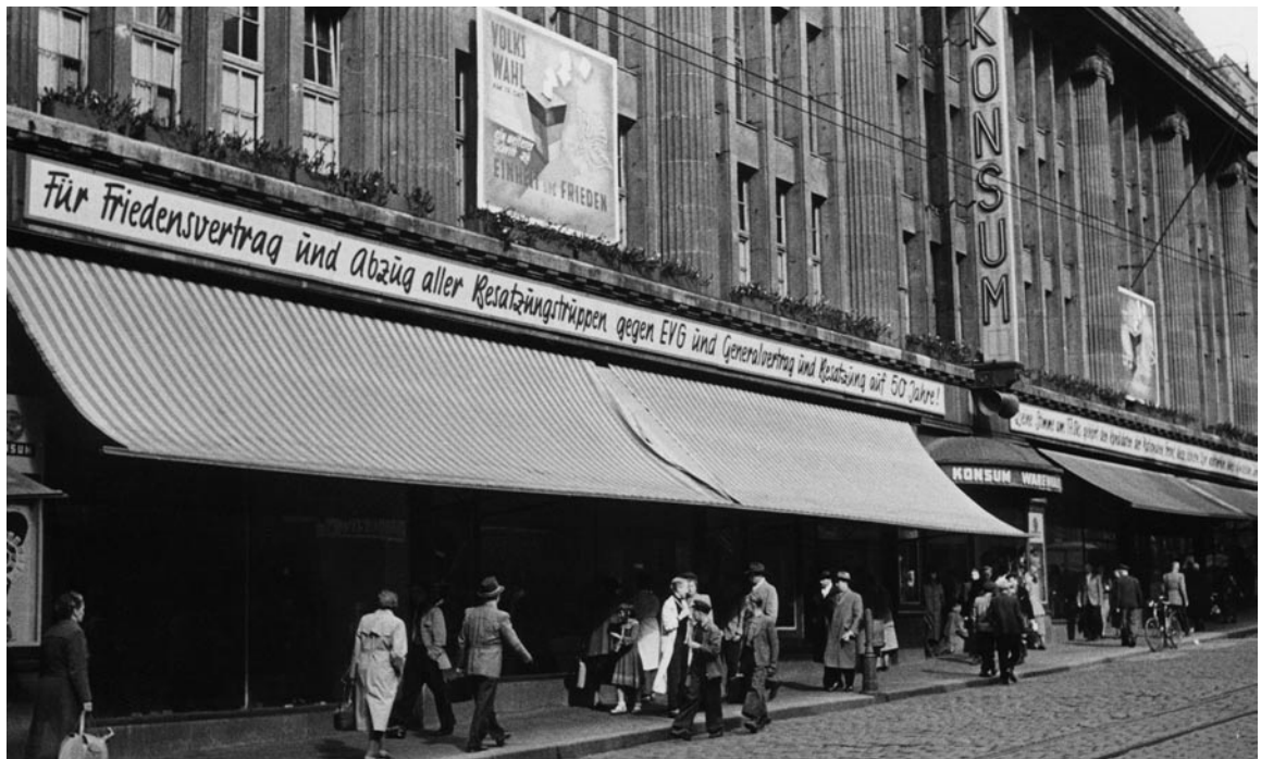
undatiert

LPG Clöwitz auf Agitationstour. Unter der Deutschlandfahne und mit dem Fünfjahrplan-Symbol voran: „Es lebe der Friede – Nieder mit den Kriegstreibern!“